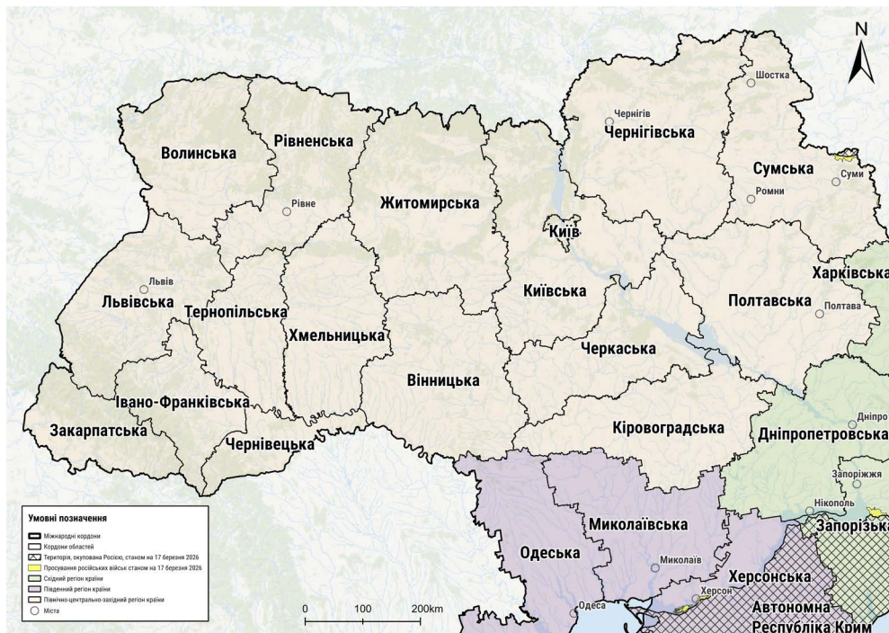
Карта 4. Північно-центрально-західний регіон