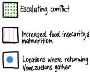
Ilustración por Sandie Walton-Ellery